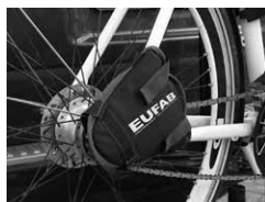
Figura 7: Protezione catena applicata