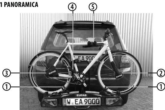
Figura 1: Panoramica