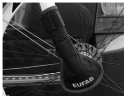
Figure 5: Mounted fork guard