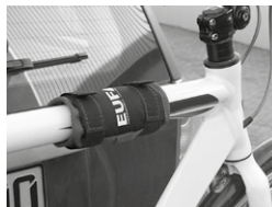
Figure 11 : Monter la protection de cadre