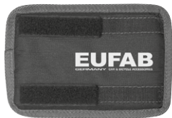
Figura 10: Protezione telaio