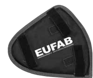
Figura 6: Protezione catena