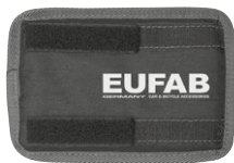
Figure 10 : Protection de cadre