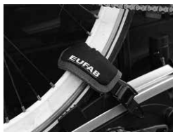
Figura 3: Protezione cerchi applicata alla cinghia di fissaggio