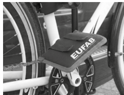
Figure 9 : Monter la protection de pédales