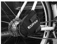
Figure 7 : Monter la protection de chaîne