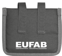
Figura 8: Protezione pedali