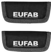
Figure 2: Rim guards