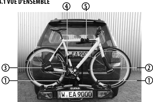
Figure 1 : Vue d'ensemble