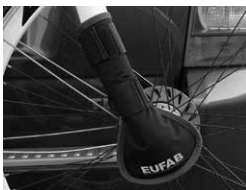
Figure 5 : Monter la protection de fourche