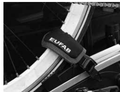
Figure 3: Rim guards mounted to securing strap