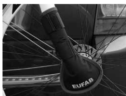
Figura 5: Protezione forcella applicata