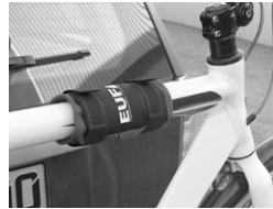
Figure 11: Mounted frame guard