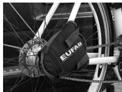
Figure 7: Mounted chain guard