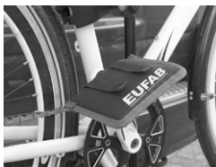
Figura 9: Protezione pedali applicata