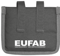
Figure 8: Pedal guard