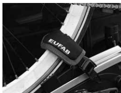
Figure 3 : Monter la protection de jantes au niveau de la sangle de fixation