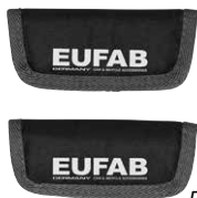
Figure 2 : Protection de jantes