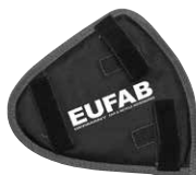
Figure 6: Chain guard