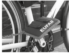
Figure 9: Mounted pedal guard